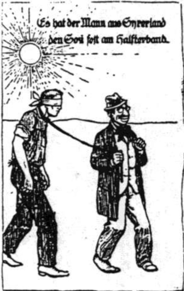
Abb. 1: „Mann aus Syrerland“ aus: Wiener Neustädter Nachrichten 9, 3. März 1934, S. 1.