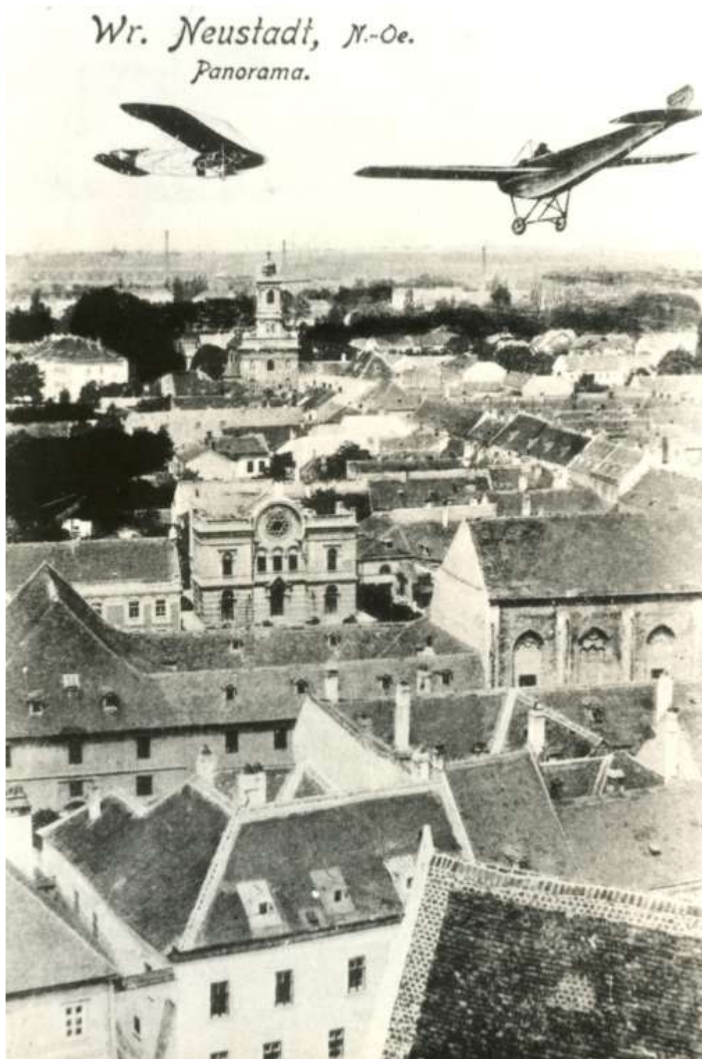
Abb. 1: Wiener Neustadt – Blick von der Innenstadt in Richtung Norden (Postkarte, um 1910)