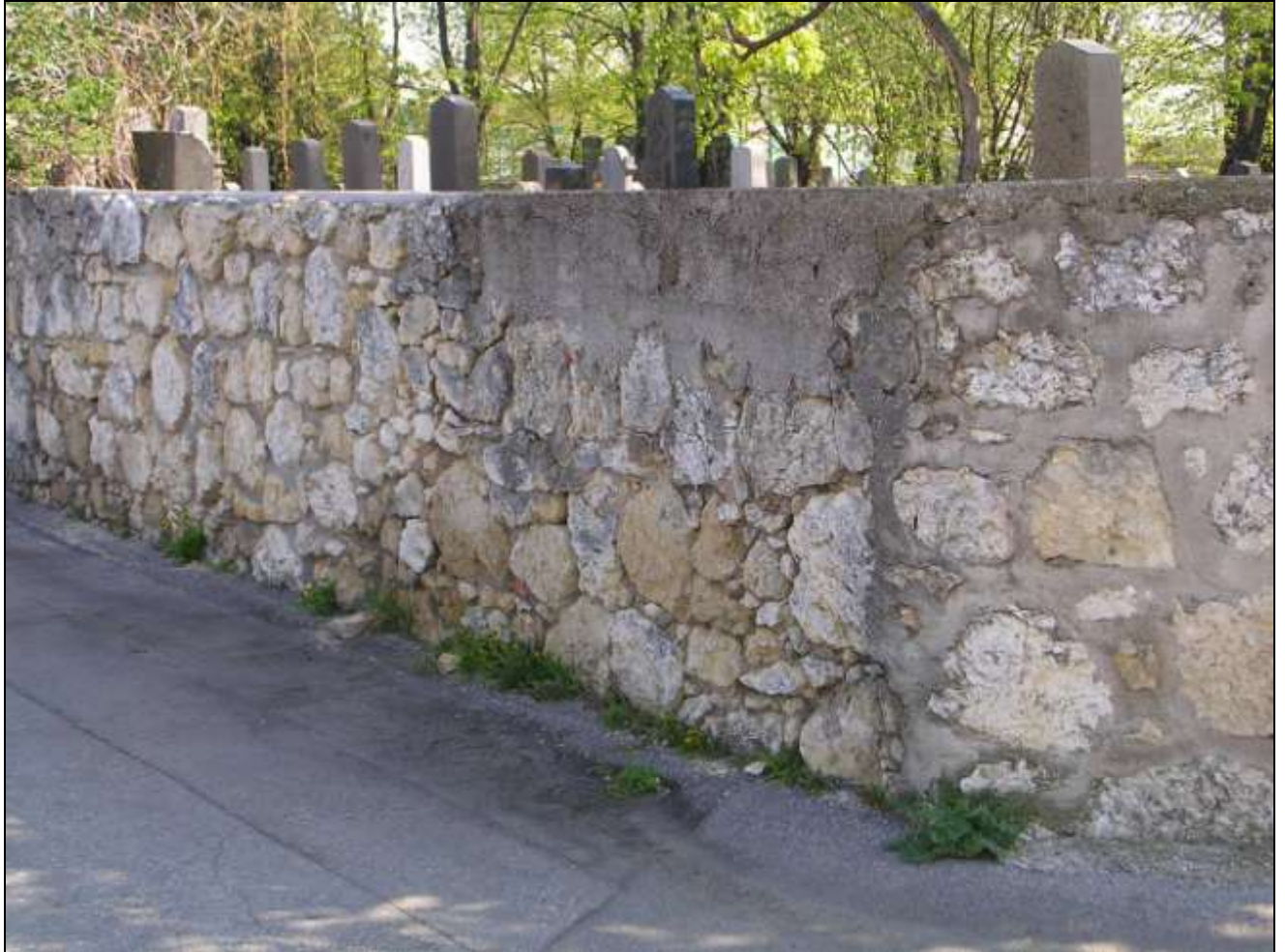
Bild 13: Westmauer (außen) Bsp. sanierungsbedürftigen Abschnitt (mittig, links) und sanierter SW-Ecke (rechts)