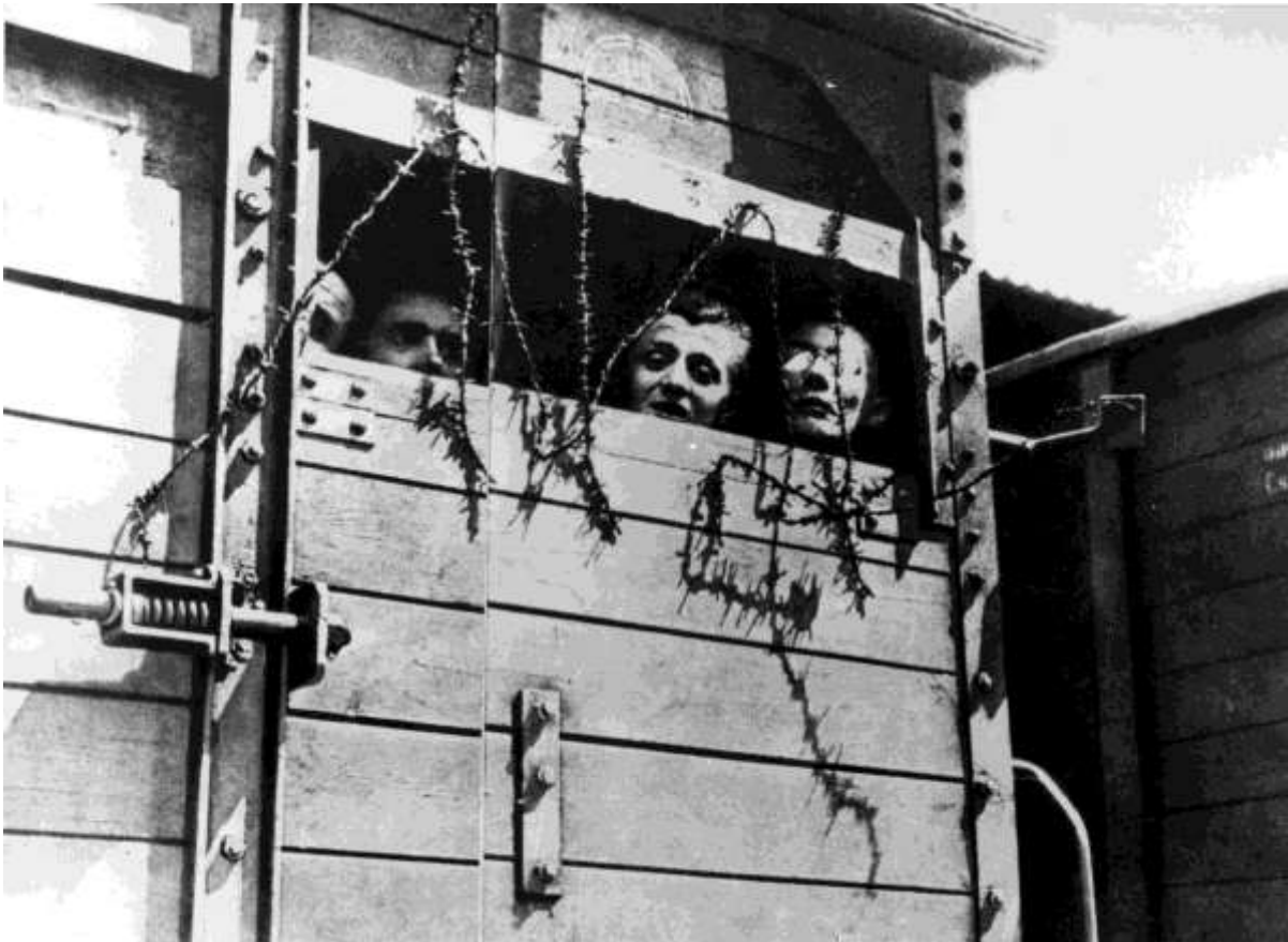
Abb. 4: Juden in einem Viehwaggon Inv.Nr. 316-13