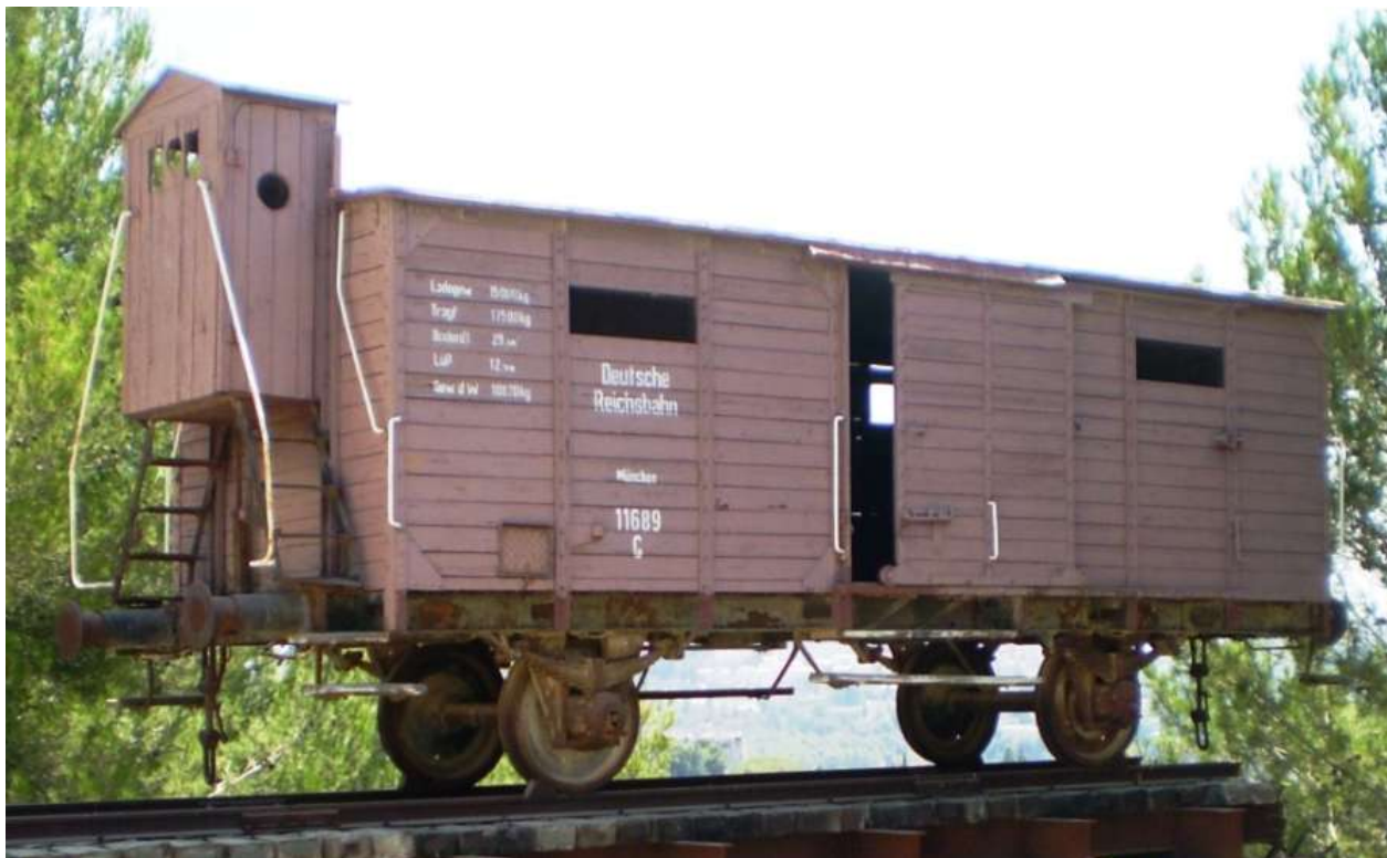
Abb. 1: Waggon der Deutschen Reichsbahn